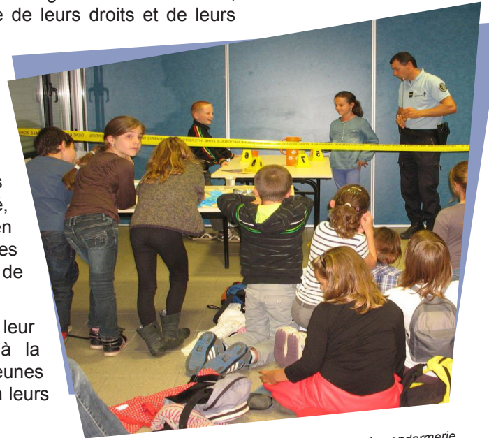
Les élèves de 6 e à la découverte de l'activité de la gendarmerie

Le succès du rallye-citoyen ne se dément pas : depuis 5 ans, ce sont près de 8 000 élèves qui ont décroché leur permis citoyen. Pour accompagner le développement de cette belle initiative citoyenne, la gendarmerie nationale a même fait appel à un renfort, une jeune engagée du service civique, chargée de promouvoir le rallye citoyen dans les territoires, en lien avec les correspondants « prévention de la délinquance » du département. Gageons que cette action touchera encore bien des collégiens.