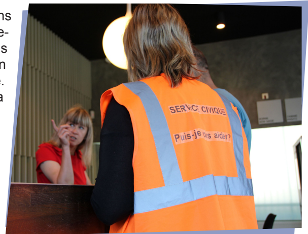
À la préfecture, une volontaire du service civique et un agent d'accueil renseignent un usager

Les profils des volontaires et leurs missions sont très variés : hommes et femmes, diplômés ou non, ils travaillent pour la solidarité, la culture et les loisirs, la mémoire et la citoyenneté, etc. En 2017, l'objectif est de développer le service civique dans les collectivités territoriales, les associations et les services de l'État.