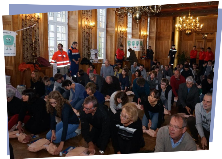
2 novembre 2016, « samedi qui sauve » dans la salle des mariages de la mairie de Nantes.

On estime à 8 000 personnes environ le nombre de personnes qui sont indirectement sensibilisées sur ce sujet par l'intermédiaire de ces formateurs.